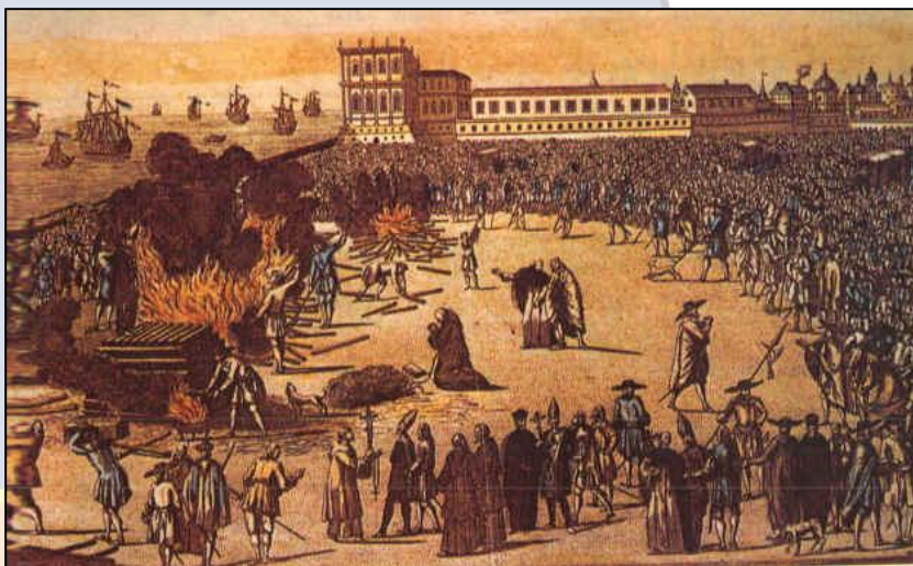
Pintura portuguesa do século XVIII que retrata a condenação pela inquisição

Autoridade: para consolidar o seu poder e adquirir o respeito da população, a Igreja mantinha uma série de instrumentos de repressão, como o Tribunal da Inquisição . Esse tribunal tinha como função julgar e condenar os hereses . A morte na fogueira era uma prática comum usada contra o acusado.